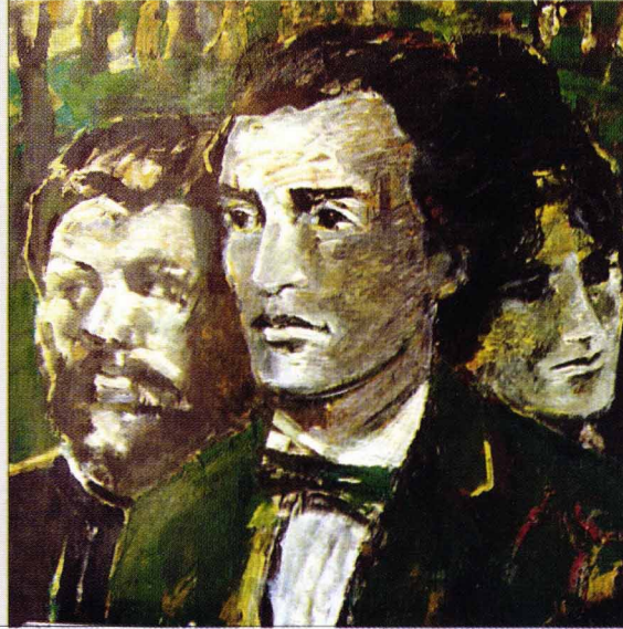
Eminescu, Creangă și Veronica Micle Tablou în ulei de Ion Neagoe